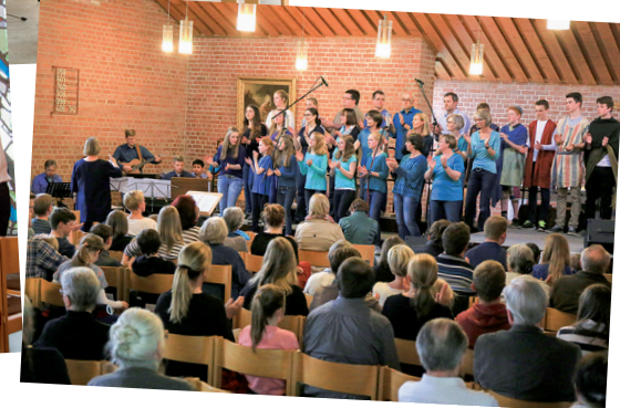
Musik in der Kirche hat viele Facetten