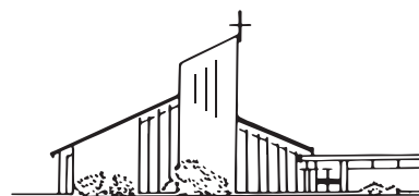
Evangelische Trinitatiskirche Wehrda

Sie finden uns im Internet unter: www.trinitatis-kirche.de